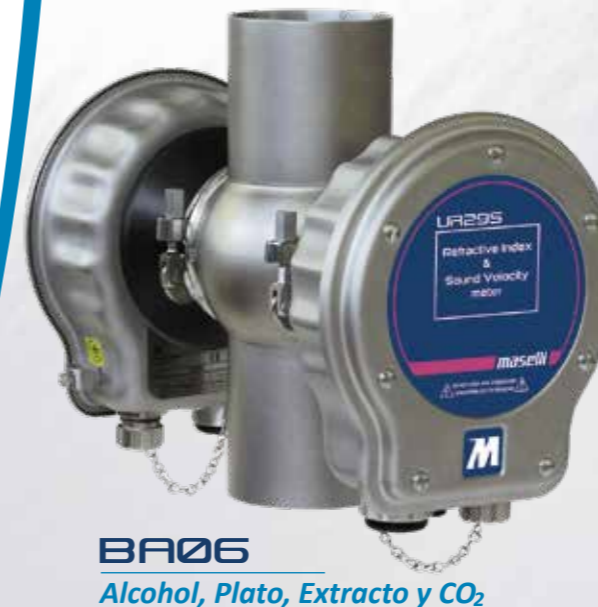
BA06 Alcohol, Plato, Extracto y CO 2