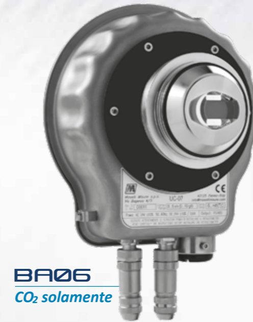
BA06 CO 2 solamente

instalación: asimismo, los sensores pueden conectarse fácilmente a los receptores MP01 o MP02, diseñados para un interfaz fácil de utilizar. El equipo no tiene partes móviles , lo que hace que sea muy resistente y que prácticamente no requiera mantenimiento : asimismo, los nuevos sensores ópticos para la medición de CO 2 se basan en el principio de infrarrojo ATR, que permite eliminar los costes elevados de mantenimiento de los analizadores tradicionales presión/temperatura.