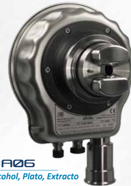
BA06 Alcohol, Plato, Extracto