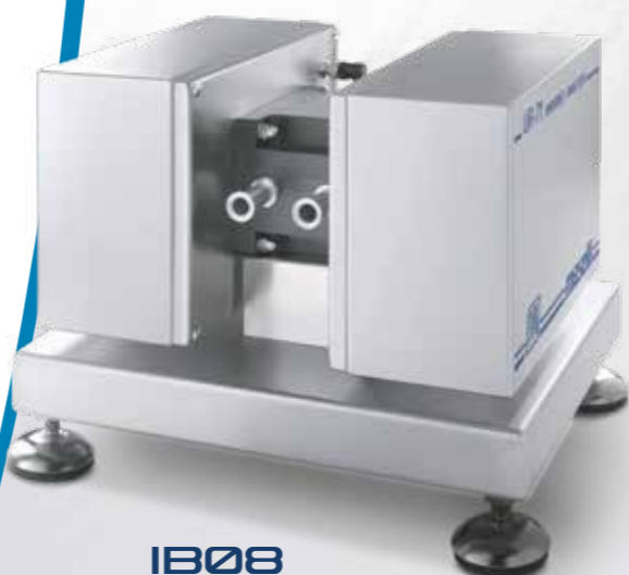
IB08 Brix-Diet CO 2 P/T