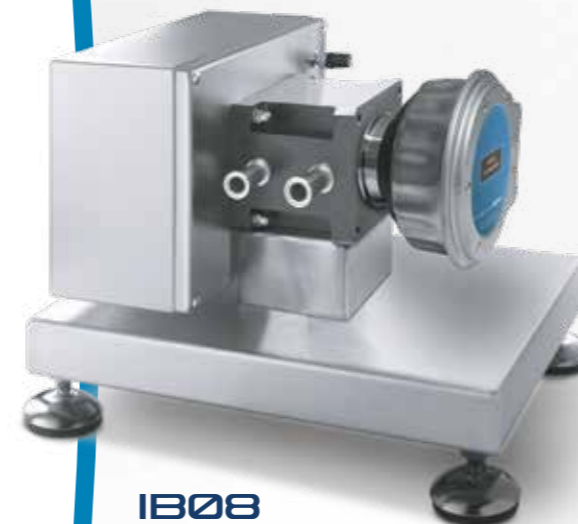
IB08 Brix-Diet CO 2 IR